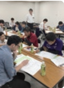
中谷氏からBCPの必要性について学び、自社の分析と他部員との連携方法の検討を進める参加者