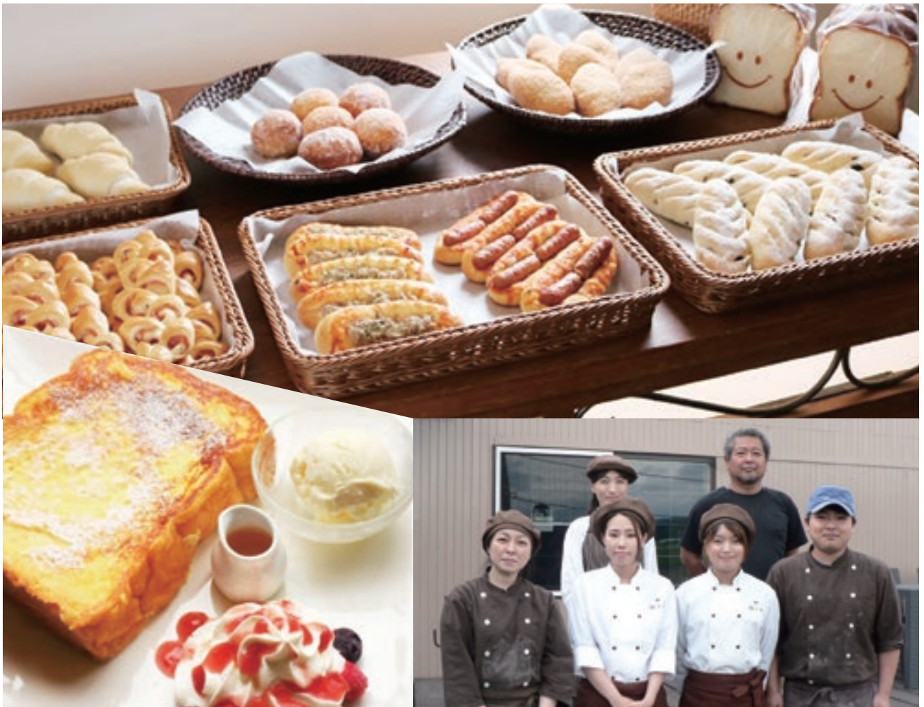
素材にこだわったパンとカフェメニューが楽しめるベーカリーカフェ「満てん」