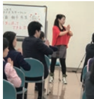
「企業出張フィットネス」は、仕事の気分転換に良いと好評です

外部環境分析、内部環境分析や市場のニーズ調査を実施し、新たなフィットネス教室の実施による受講者増加の可能性を検討しました。その中で、近年、働き方が問われる中、各企業が福利厚生に注力している点に着目しました。更に、それぞれのコースの料金設定や販促方法等も一緒に検討していただきました。調査の結果、中部地区にはパーソナルトレーニングを本格的に行っているところ