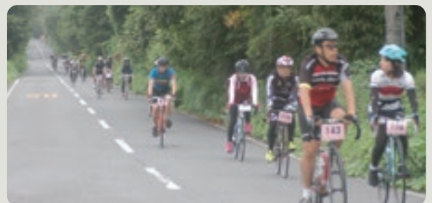
コースを爽快に駆けぬける参加者の皆さん