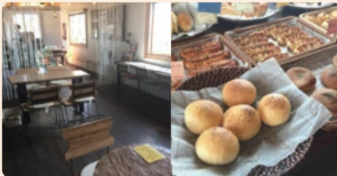
(右)県内食材を生かした、体に優しいおいしいパンが店内にずらりと並びます (左)カフェメニューだけでなく、購入したパンを店内で食べることもできます

「食材にこだわり抜いて 安心安全なパンを提供」 CUBE ONE株式会社 (伯耆町商工会)