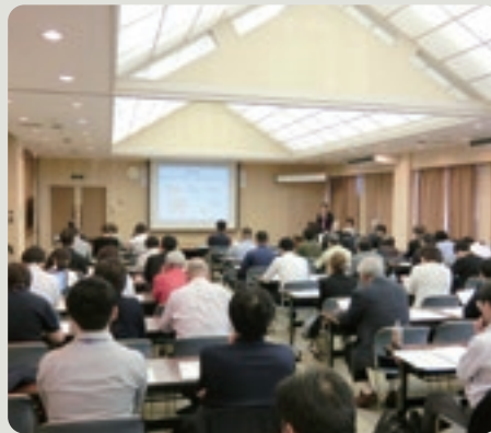
スタートアップセミナーには多数の事業者が参加