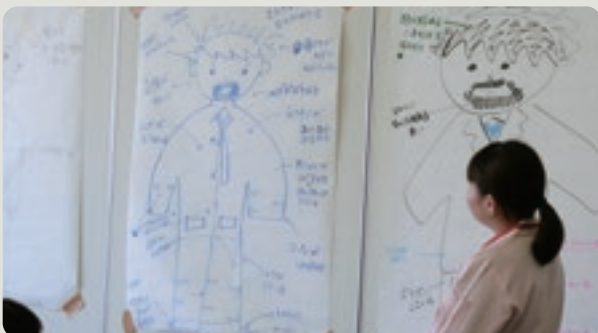
グループワークで話し合った「社会人としての身だしなみ」を発表する受講生

研修後のアンケート結果では、全員が役に立ったと回答され、企業の未来を担う人材育成のため、今後も継続開催していく必要性を感じました。