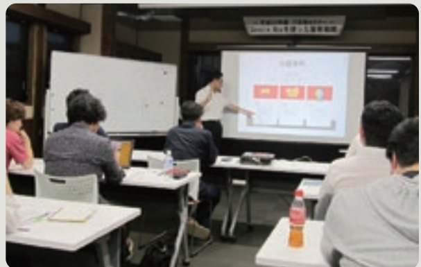
真剣に学ぶ参加者たち

三朝町商工会は6月19日、20日の二日間、「Google MAPを使った集客戦略」をテーマにIT活用セミナーを開催しました。「0円で出来る!MEO対策」ではWEB検索時に上位表示をされる対策や店舗や店舗内をいかに魅力的に発信するか等を学びました。参加者からは、手軽な操作で登録や更新ができ、今一番効果的であると言われていたMAPを活用することで、自社の情報発信やPRを積極的に行っていききたいとの声が多く聞かれました。