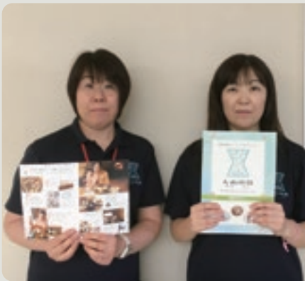
周遊冊子・商品カタログ

以上の事業により、鳥取県西部地域が一体となって、地域への集客及び交流を図り、小規模事業者等の継続的な需要創出に繋がっていきます。