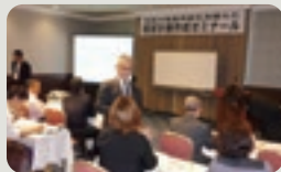
昨年度開催のセミナー