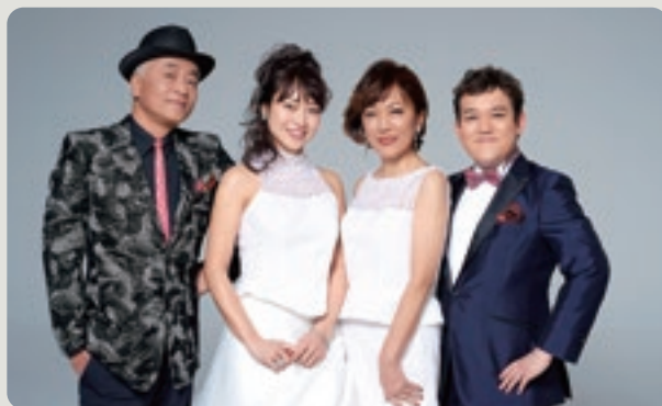
スペシャルゲスト「サーカス」