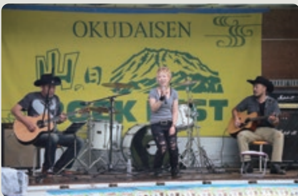
アーティストとの「近距離」が魅力

江府町恒例の夏フェス「奥大山ROCK FES2018(入場無料)」を8月11日(土)に開催します。町出身者やゆかりのアーティスト約11組によるライブで「大山開山1300年」の山の日を奥大山スキー場から盛り上げます。