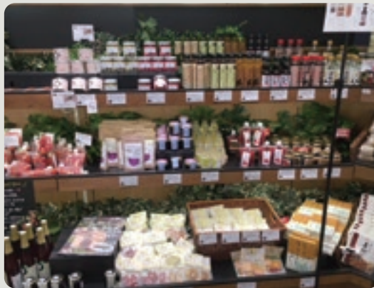
「とりそらたかく」商品コーナーで販売

いきます。5月初旬には榎サンインマルイ上井店(倉吉市伊木)で一括取引が始まるなど効果がでてきています。