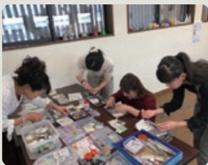
まちゼミ開催中の様子

「あなたから買いたい」「あなたに会いたくて来たの」と店のファンと価値を作る商売を、商工会はこれからも継続して支援していきます。