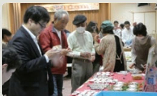
意見を交わしながら試食する参加者

鳥取市西商工会では、しょうがやアカモク等、西いなば地域の特産品を使用した商品開発を進めており、今年度は昨年の試作品を改良し、パッケージまで完成させました。