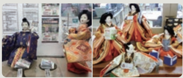
町内各所で展示される「福よせ雛」

人口3000人の町にお雛様3000人が移住し、住民が倍増!!役場では、お内裏様が日野町長に扮して皆さまをお迎えし、商工会では三人官女が経営支援を行う様子を表す等、ユーモアと愛嬌のある「福よせ雛」を平成31年2月上旬から4月初旬まで日野町各所で展示します。