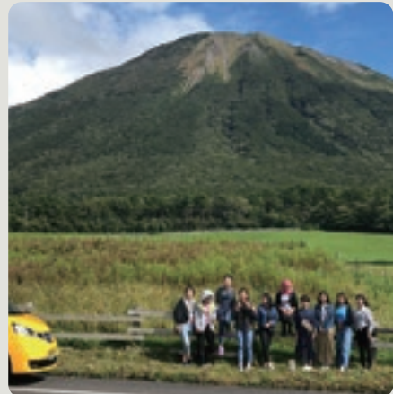
雄大な大山をバックにパチリ

これらのツアーを踏まえてインバウンド向け周遊冊子を発行し、域内への流入人口を増やすべく今後とも「大山時間」事業の推進に努めていきます。