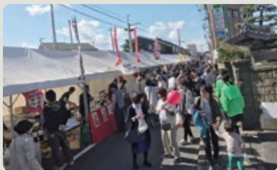
たくさんの人で賑わう赤碕駅前

10月28日(日)、かつてのJR赤碕駅前の賑わいを取り戻したいと青年部と地域の人が実行委員会を組織し、企画から当日の運営まで実行委員が主になり、「ほこ天ピチパル商店街」を開催しました。歩行者天国にした会場では、グルメストリートやステージイベントを実施。町内にこれほどの人がいいたのかと思われるほどの来場者があり、一日中賑わいました。商工会も会員事業所が出店する琴浦朝市を実施し、賑わい創出の一役を担いました。