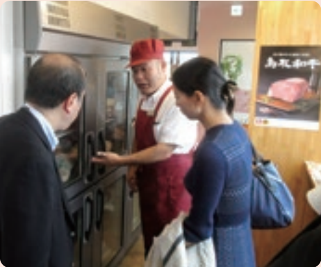
バイヤーによる事業所視察(あかまる牛肉店)