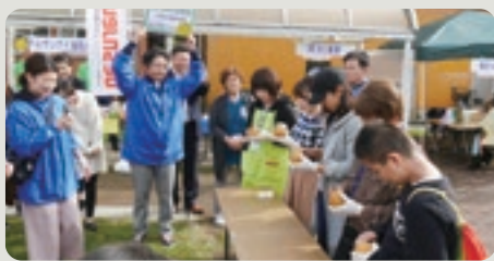
会員事業所が生産している梨を使った「皮むき対決」は大好評!!

同日に共同開催された「用瀬宿横丁さんぼ市」も野点イベント等で盛り上がっていました。