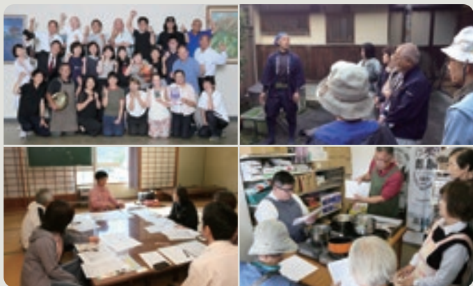
町内の24会員が合計36の講座を展開しました

智頭町商工会では、10月15日(月)から11月15日(木)にわたり、「第1回智頭まちゼミ」を開催しました。事業者が講師となつて地域住民を対象に少人数ゼミを実施。店の特長、こだわり、人柄などを広く知ってもらうことで、顧客とのつながりや関係を深めました。今年度は、約200人が受講され、アンケートでもこの取り組みに対して高い評価が多く、来年度のさらなる充実実施につなげていきます。