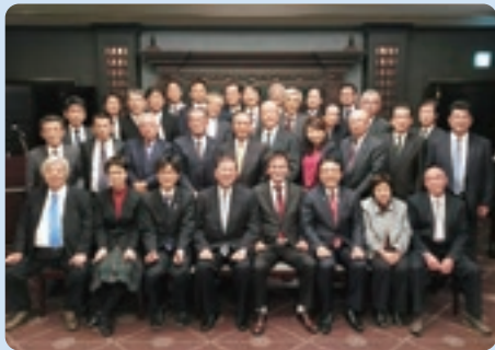
国会議員との懇談会で和やかに意見交換

また、全国大会終了後、県選出の国会議員との懇談会を開催し、意見交換を交わすとともに、全国大会で決議された陳情書をお渡しし、商工会へのさらなる支援を要請しました。