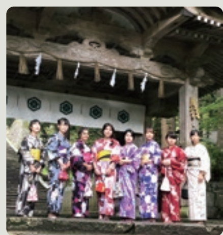
大山寺を浴衣で散策