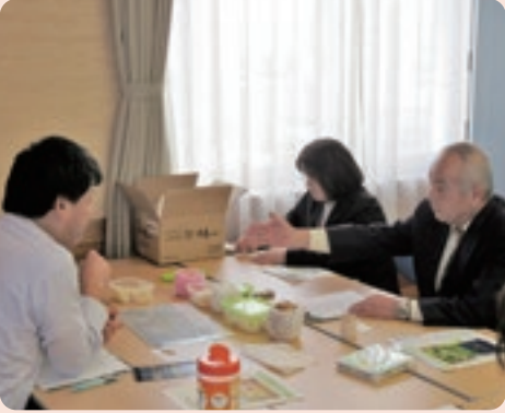
バイヤーに商品の特長をプレゼン(さんこうえん)

視察（大谷酒造(株)、(株)あかまる牛肉店）を行い、製造現場および販売店の様子を実際に確認することで、各事業所の衛生管理等への理解を深めていただきました。