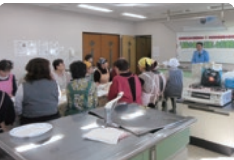
ミニ防災セミナーで日頃の備えの大切さを学ぶ参加者

その後、鳥取市東・智頭町・三朝町・北栄町・夢浦町の女性部代表がローリングストックレシピの提案内容を説明し、調理・試食を行いました。今年新たに11レシピの提案があり、レシピはHPで紹介予定です。