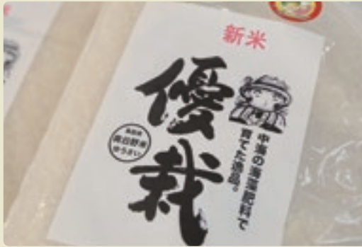
刷新した商品パッケージ

左に右に折れながら山道をたどると、傾斜地に沿って段々と連なる棚田に行き着く。標高約400mの山あいにある日野町別所地区。過疎化が進むこの農村部で、地域活性化の期待を背負うブランド米作りが進む。中海の海藻を肥料にした「コシヒカリ」鳥取海藻米だ。