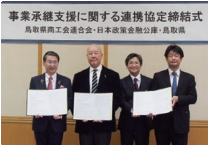
左から、平井鳥取県知事、土井県連会長、日本政策金融公庫 竹内米子支店長・堂脇鳥取支店長

るための手段の一つです。だからこそ、相互理解を深めるためにも時間を要します。もし、事業承継についてお悩みでしたら、まずはご相談だけでもお早目にお申し付けください。