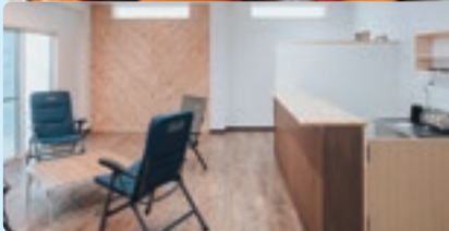
工場一部を改装して完成した商談スペース