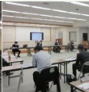
1.24開催の 東部地区懇談会