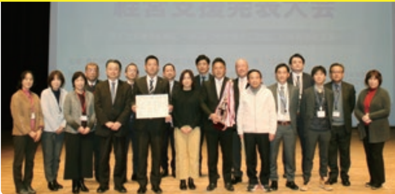
最優秀賞を受賞した中部センターと支援先の関係者

鳥取県商工会連合会と県内3商工会産業支援センター、18商工会は2月2日、倉吉未来中心で「第23回経営支援発表大会」を開催しました。3年ぶりにリアル会場での開催となった今大会。会員事業者、行政、金融機関など、約130名が見守る中、3人の経営支援専門員が登場し、事業者へ行った支援を発表しました。 大会は、伴走型支援の成果を「見える化」することで、商工会の活動を周知するとともに、経営支援の資質向上や関係機関との連携強化を図り、事業者の持続的発展につなげることを目的に開催しています。