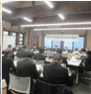
1.17開催の 中部地区行政懇談会