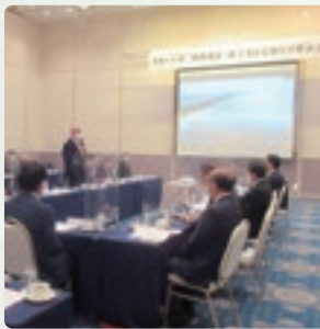
2.17開催の 西部地区行政懇談会

懇談会の内容を活かし、地域経済の活性化に向け、引き続き小規模事業者に寄り添った支援を進めていきます。