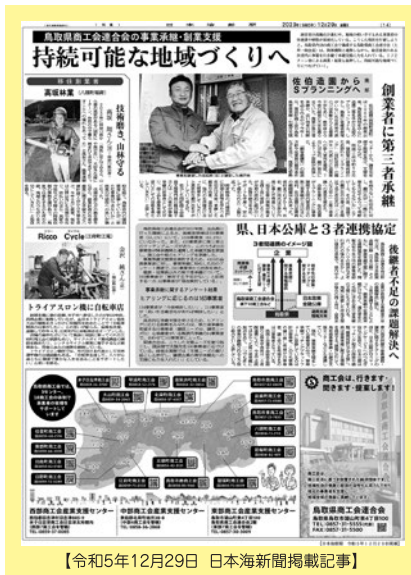
【令和5年12月29日 日本海新聞掲載記事】

令和5年度には、会員アンケートで把握した事業承継ニーズと創業希望者の潜在的なニーズをつまみコーディネーター、譲り渡す側譲り受ける側が一緒に仕事をすることで相互の人柄や仕事への取組み方の理解を深め、令和5年12月に第三者への事業承継が