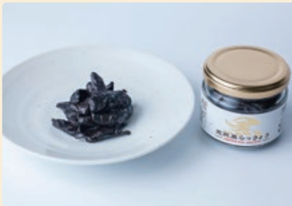
果実のような甘味で栄養価も高い黒らっきょう