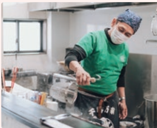
麺や出汁を徹底的に研究