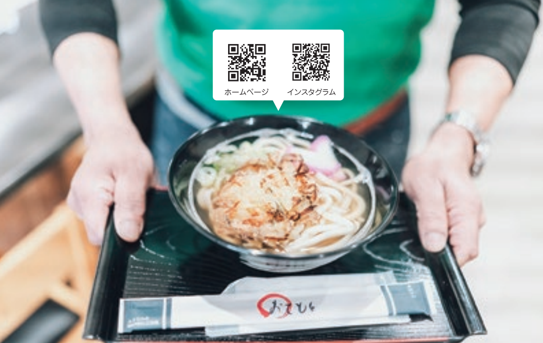
コシの強さと深い味わいで人気のうどん

昭和民宿 龍神荘／岩美町商工会 住所 岩美町大羽尾274-1 TEL 0857-72-0286