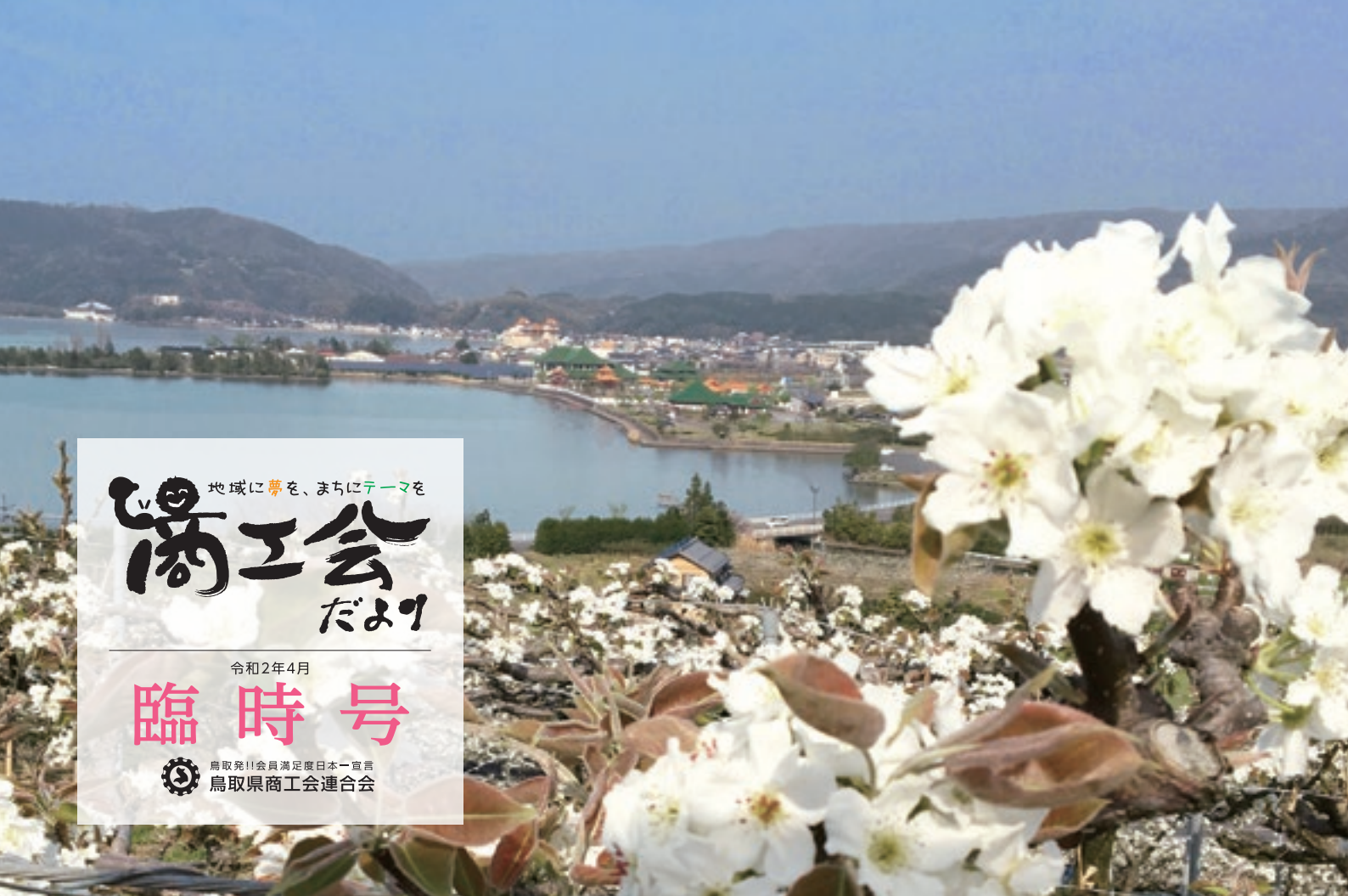
湯梨浜町の東郷湖